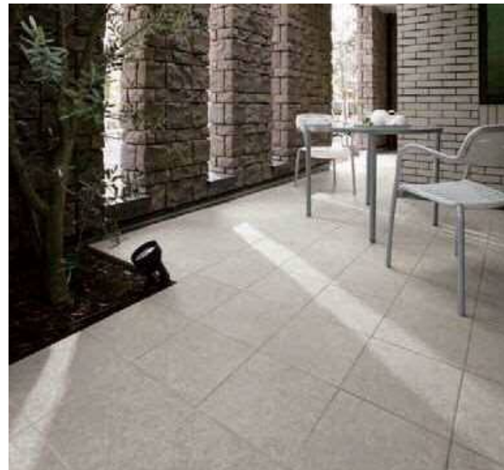
グレイスランド施工例 ＜スレート調＞ IPF-300/GRL-5