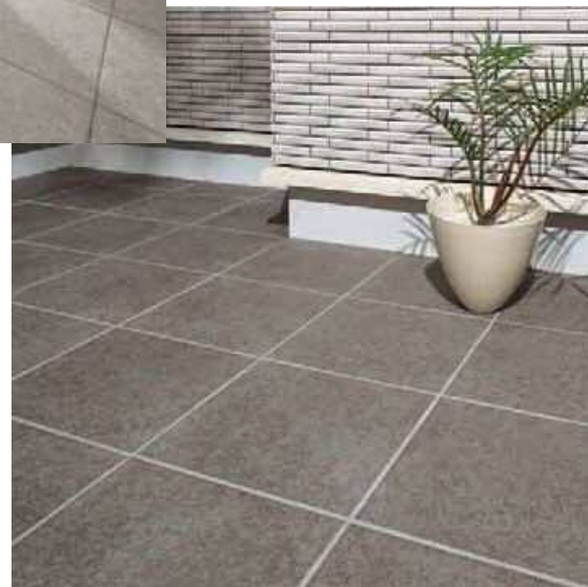
グレイスランド施工例 ＜グラニット調＞ IPF-300/GRL-12