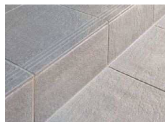
[段鼻納め] ※イメージ

切り物が少なく、割り付けの作業がラクな平納め。見た目にスッキリとした納まりで、リーズナブル。